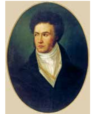
Ludwig van Beethoven, Gemälde von Isidor Neugaß, 1806

Der 1891 auf einem russischen Landgut geborene Sergej Prokofjew wuchs mit Beethoven-Sonaten auf, die seine Mutter spielte und die ihm sein Lehrer Reinhold Glière analysierte und erläuterte. Sie blieben die Modelle für Prokofjews Symphonien und Streichquartette. Als der Komponist 1941 in einer Autobiographie auf die verschiedenen Quellen seiner Musik verwies, erwähnte er eine »moderne Linie«, verkörpert durch Sergej Tanejew, eine »motorische Linie«, verkörpert durch Schumanns C-Dur-Toccata op. 7, eine »lyrische Linie« sowie eine »groteske Linie«. An erster Stelle stand für Prokofjew aber die »klassische Linie« Ludwig van Beethovens. Sie erhielt für ihn ein noch größeres Gewicht, als er sich etwa ab 1934 um eine »neue Einfachheit« bemühte. Nach vielen Jahren im Ausland plante Prokofjew damals die Rückkehr in seine russische Heimat, zumal er optimistisch glaubte, seine Ästhetik lasse sich mit der offiziellen sowjetischen Kunstauffassung vereinbaren. Ohne die bald folgenden brutalen Verfolgungsmaßnahmen unter Stalin zu ahnen, forderte der Komponist in Artikeln für Moskauer Zeitungen eine »Musik, die technisch wie konzeptionell der Größe unserer Epoche angemessen ist«. Zu ihr gehörten an erster Stelle Melodien, die leicht verständlich, aber nicht banal sein durften.